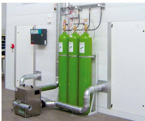
Centrała przeciwpożarowa - Argon 55 i kontrola wilgotności

Produkty są składowane w pojemnikach na rolkach. Pulpit może być wyposażony w prowadnice kulkowe.