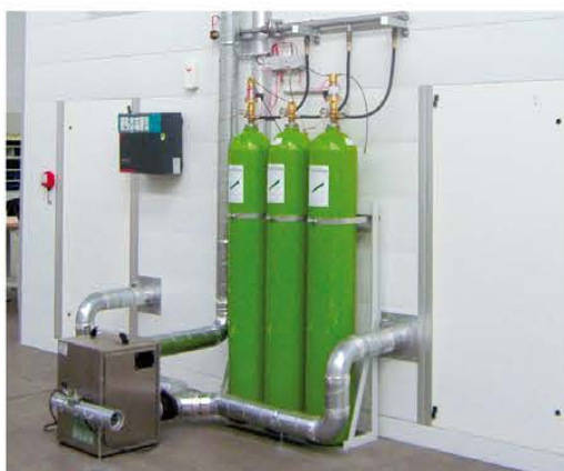
Centrala przeciwpożarowa - Argon 55 i kontrola wilgotności

Produkty są składowane w pojemnikach na rolkach. Pulpit może być wyposażony w prowadnice kulkowe.